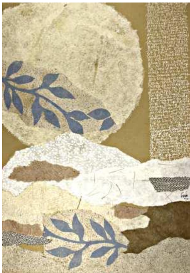
Lune d'Albâtre 55x80