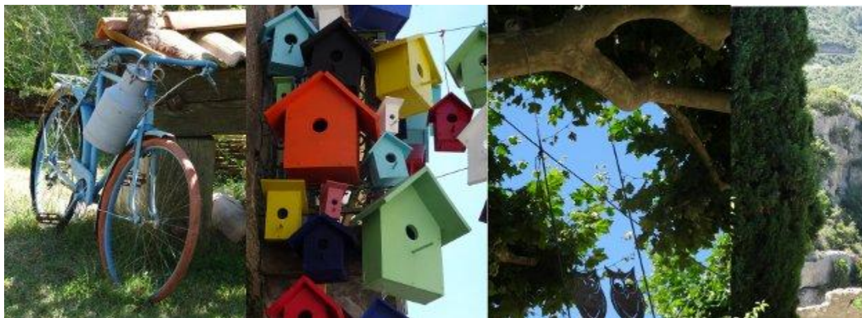
Montolieu (Aude)

Galvanisée d'une énergie nouvelle, je vous propose quelques dates pour nous retrouver autour de mon actualité artistique.